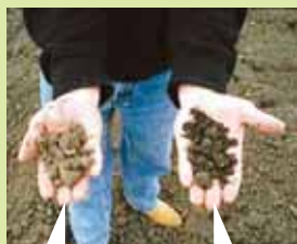
左:MLC 未処理の土 右:MLC散布後 2週間の土